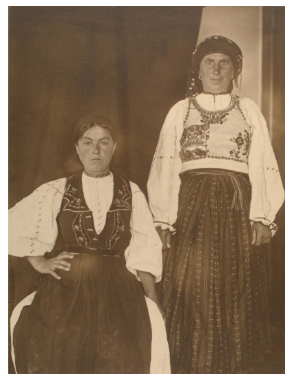
Figură 6 New York Public Library, Raffius 104PH714, R.I. Nesmith and Associates, Romanian Women

Fără îndoială, unii dintre actorii care s-au bucurat de succes în urma fluxului mare de emigranți de pe ambele maluri ale Atlanticului au fost companiile navale. Din informațiile reținute de Serviciul de Imigrație și Naturalizare, vasele care ajungeau pe coasta americană transportau între 4000 și 7000 de pasageri. Succesul lor comercial se datora într-o bună măsură și campaniilor publicitare. Acestea distribuiau diferite materiale, de la pliante promoționale cu informații detaliate și fotografii până la fluturași de mici dimensiuni (Figura 7), propunând o ofertă diversificată, în acord cu bugetul călătorilor. Cu toate că cele mai atrăgătoare estetic erau cele care ilustrau opulența dotărilor de la clasa 1, cele mai multe bilete erau vândute la clasa a III-a.