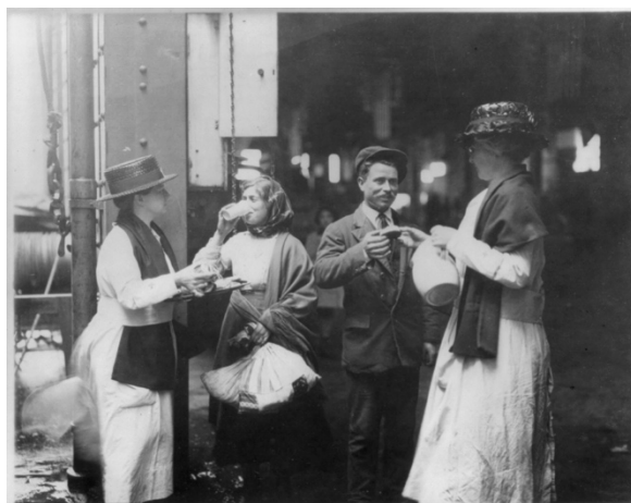
Figură 8 Library of Congress, LC-USZ62-55809, American Red cross Women Giving Food and Drinks to Newly-Arrived Immigrants