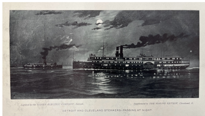
Figură 5 Vasele Detroit și Cleveland - în trecere, noaptea

Analizând listele pasagerilor plecați din Șona, se pot observa situații precum cea din 6 aprilie 1906, când nouă șoneri ajung la Ellis Island la bordul vasului Chemnitz. Câteva luni mai târziu, pe 14 ianuarie 1907, alți șase șoneri, ajung în America la bordul aceluiași vas. Situația se multiplică și pe 21 decembrie 1912, când soneri ajung cu vasul President Lincoln, pe 4 iunie 1913, cu vasul Cleveland (reprezentat în Figura 5), și 17 aprilie 1914, cu Rochambeau. Listele