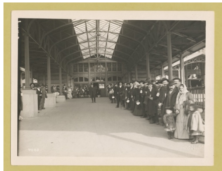
Figură 9 Passed and waiting to be taken out of Ellis Island

De îndată ce obțineau acceptul din partea autorităților, imigranții primeau un carton/biletul de tren pe care erau obligați să îl poartă în piept până la momentul părăsirii insulei (ca în fotografia din Figura 8). Aceasta reprezenta, în cele din urmă, garanția formală că își pot continua călătoria pe teritoriul american.