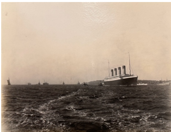
Figură 3 Library of Congress, LM337, lot 9502, The S.S. Olympic.

De asemenea, unii călători primeau din partea companiilor cu care urmau să călătorească materiale informative ce conțineau sfaturi utile care să-i ferească de abuzuri sau șarlatanii. De exemplu, compania Cunard Hungarian-American Line a redactat, în 1905, un material de informare adresat emigranților maghiari ce plecau din Fiume, prin care erau sfătuiți să-și declare sosirea la consulatul din New York, le erau aduse la cunoștință limitele de greutate ale bagajelor, condițiile de călătorie, modalitatea de achiziționare a билетelor de tren în America, cote de schimb valutar etc. 12 Sunt mari șanse ca și șonerii plecați pe această rută să le fi citit. Mai mult, este la fel de plauzibil că și alte companii distribuiau materiale similare propriilor pasageri.