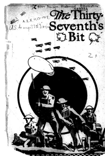
Figură 2. Coperta cărții The Thirty-Seventh's Bit , reproducere de pe microfilm, New York Public Library

ajunși zilnic în America, aceasta poate fi descifrată și analizată prin cercetarea Arhivelor Naționale. Acolo se află întreaga arhivă, cuprinzând mii de pagini, pe care diverse instituții ale statului american le-a redactat în legătură directă cu procesul de imigrație. Rapoarte ale administrației Ellis Island, situația pe luni și ani a intrării vaselor cu imigranți în port, datele înregistrării, carantinării și selecției pasagerilor, studii realizate cu scopul de a determina motivele emigrării din anumite țări ale Europei, pliante de promovare ale companiilor transportatoare și multe altele sunt găzduite în sediul din Washington al NARA (NARA 1 9 ). Volumul de documente este masiv și parcurgerea lor este anevoioasă, în lipsa unor inventare exhaustive. Informații de detaliu pot fi găsite doar prin parcurgerea documentelor dosar cu dosar.